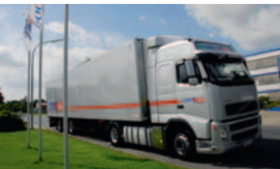
Das Durchschnittsalter der Cool-Trans-Fahrzeuge beträgt weniger als drei Jahre.