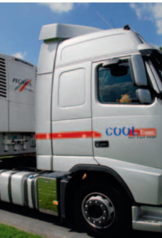
Der Sattelaufleger mit der Pegasus-Kühlanlage absolviert einen Testlauf bei Cool Trans.

Angeboten werden Dienstleistungen rund um den Lebensmitteltransport aller Art im Komplett- oder Teilladungsbereich, vorrangig Transporte mit eigenen Kühlfahrzeugen, die mit effizienten Tiefkühlmaschinen und Rohrbahnen für Hängendfleischtransporte ausgerüstet sind. Darüber hinaus steht ein Kühlhaus mit einer Lagerfläche von rund 2.100 m 2 für die vorübergehende Einlagerung von Tiefkühlprodukten zur Verfügung. Für eine moderne Transport- und Logistikdienstleistung werden auch GPS-gestützte Telematik und Navigation eingesetzt. „Wir wissen jederzeit, wo sich unsere Fahrzeuge befinden,