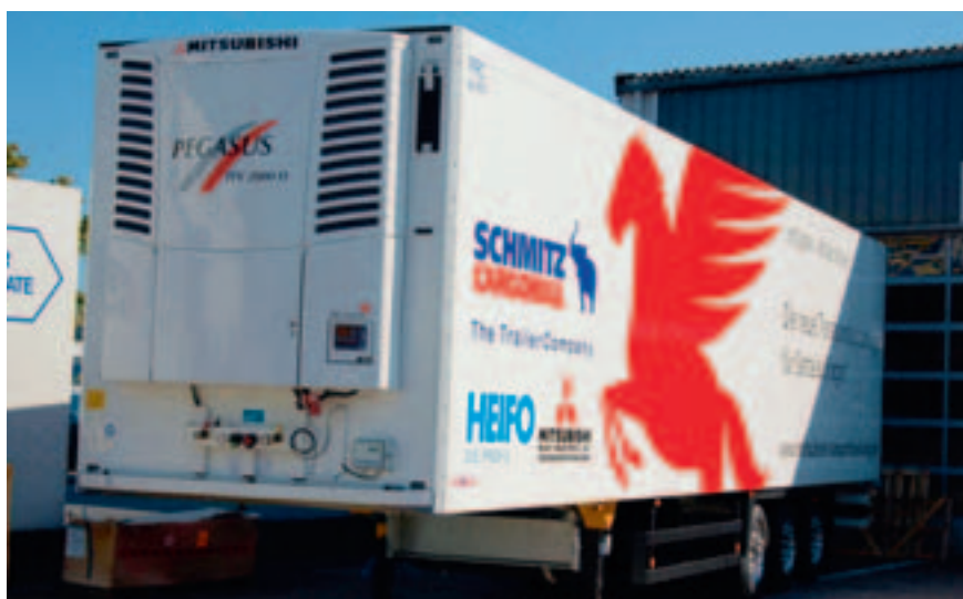
Die Gespräche von Cool Trans mit den Partnern von Heifo gehen dahin, dass das Pegasus-Aggregat nach erfolgreicher Probezeit als Gebrauchtgerät übernommen wird.