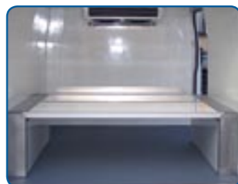
Zwischenboden GFK herausnehmbar mit Aufkantung Stirnseite