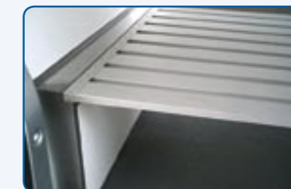
Zwischenboden Aluminium herausnehmbar mit Aufkantung Stirnseite