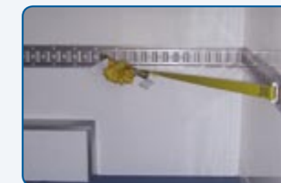
Kombi-Ankerschiene mit Spanngurt