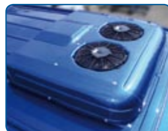
Dachhaube in Wagenfarbe