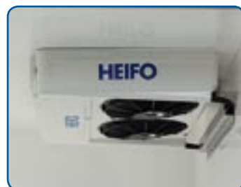
Vollintegrierte Kühlanlage HTI-2000 (kein Dachkondensator)