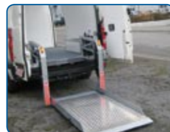
Ladelift mit Hubmatik 500 kg