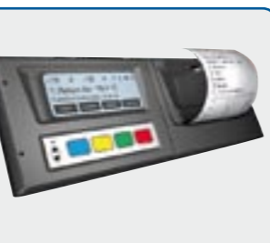
Temperaturschreiber mit Drucker