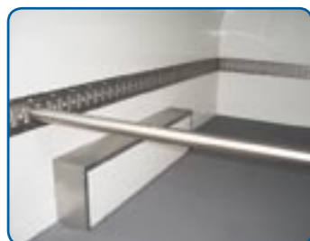
Kombi-Ankerschiene und Sperrstange zur Ladungssicherung