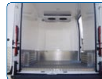
Fußboden und Scheuerleiste Aluminium-Riffelblech (für starke Beanspruchung)