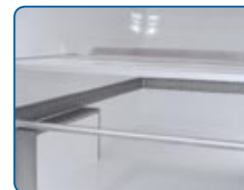
Fußboden GFK (für empfindliche Produkte)