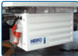
Stand-by-Kit für Standkühlung