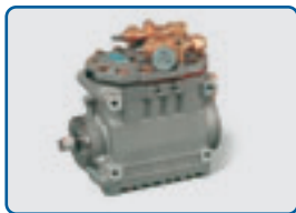
3-Zylinder-Hubkolbenkompressor für R 404 A