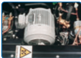
Elektromotor 400 V / 5,5 kW