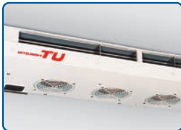
Option: 128mm- Flachverdampfer