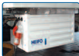
Stand-by-Kit für Standkühlung