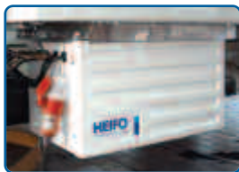
Stand-by-Kit für Standkühlung