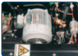
Elektromotor 400 V / 3,7 kW