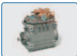
3-Zylinder-Hubkolbenkompressor für R 404A