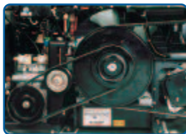
wartungspflichtige Komponenten sind leicht zugänglich